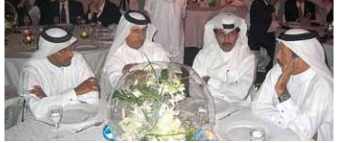
من اليمين: الوزير يوسف حسين كمال، الشيخ عبد الله بن سعود آل ثاني، الشيخ حمد بن فيصل آل ثاني والشيخ حمد بن ناصر آل ثاني