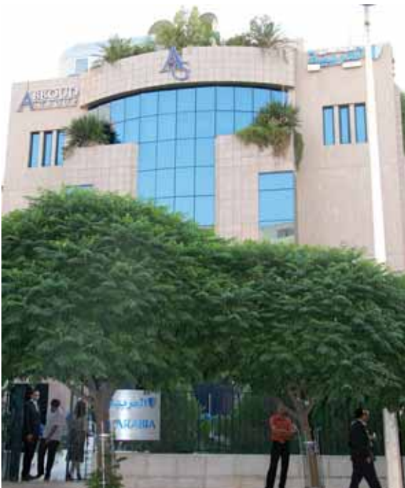
مبنى شركة التأمين العربية السورية