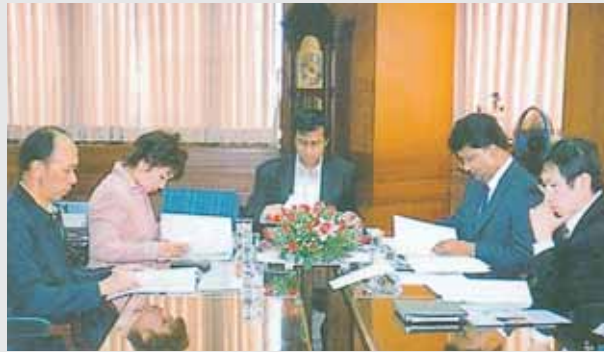
مجلس ادارة ASIAN RE مجتمعاً في بانكوك

عقد مجلس ادارة شركة اعادة التأمين الآسيوية (ASIAN RE) اجتماعه الـ ٦٩ في بنكوك عاصمة تايلاندا، حيث جرى عرض نتائج الشركة لسنة ٢٠٠٦.