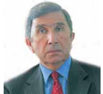
العميد اسعد غانم مدير الجمارك العام

وأبدى مصدر مسؤول في مرفأ بيروت لـ «البيان الاقتصادي» استغرابه لهذا التراجع لأنه لم يعكس الواقع الحقيقي لحركة مرفأ العاصمة التي جاءت أكبر مما كانت عليه في نيسان الماضي.