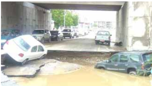
من اضرار اعصار GONU

واذا لم يكن تأسيس شركة اعادة سهلاً، فمن المرجح ان تطرح جمعية التأمين العمانية فكرة اقامة مجمع (POOL) يشارك فيه الجميع ويتولى قبول اسنادات الاعداء المحلية ويلغي الحاجة الى نظام تبادل الاخطار RECIPROCITY الموصى به من هيئة سوق المال في عُمان.