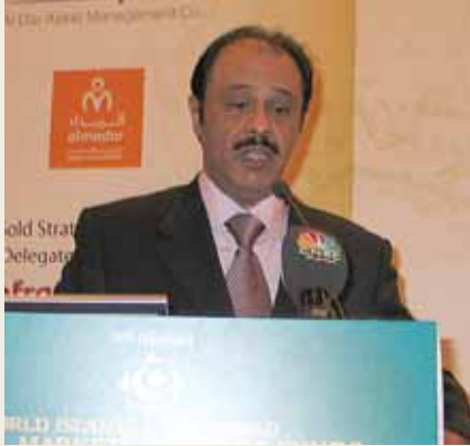
مصطفى الصالح أديم للاستثمار