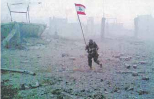
صورة لجندي لبناني وهو يسعى وسط المعركة والقتال ليرفع العلم اللبناني فوق احد المواقع التي انتزعها جيشنا البطل من الفئة الصالة.