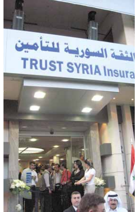
مدخل شركة الثقة السورية للتأمين