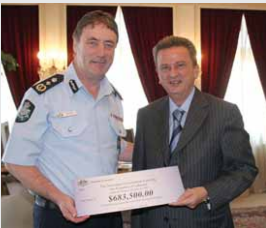
سلامه يتسلم الشيك من مفوض الشرطة الفدرالية الاوسترالية

وتبين من الكلمة التي ألقاها مفوض الشرطة الاسترالية، ميك كيلتي، خلال تسليم الشيك الى الحاكم، ان هذه الاموال هي حصيلة تغريم المهربين الغرامات، اذ قال ان التعاون بين هيئات مكافحة يوصلها الى كشف الفاعلين «وجعلهم يدفعون اثمان اعمالهم غير الشرعية، ما يشجعنا على اقتسام عائدات التهرب من دفع الضرائب او في مقابل عمليات احتيال او تبييض اموال، بحسب القوانين المرعية الاجراء في بلادنا، واعتبر انه لولا التعاون القائم بين الدول فانه لما كان الكشف عن الكثير من الجرائم المالية ممكناً.