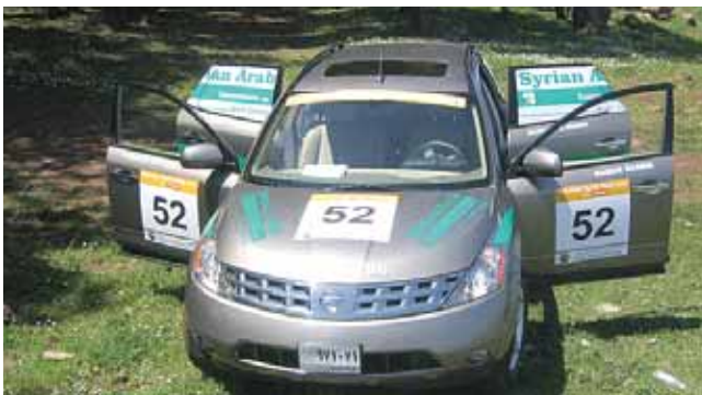
اجمل سيارة للسورية العربية للتأمين

من المشاركات اللافتة في رالي اكتشاف سوريا "DISCOVER SYRIA" الذي جرى الشهر الماضي على الطرق السورية، سيارة حملت شعار الشركة السورية العربية للتأمين وقد استطاع موظفو الشركة الاربعة بنهاية السباق الحلول في المرتبة الثانية بالاضافة الى تتويجها السيارة الاجمل.