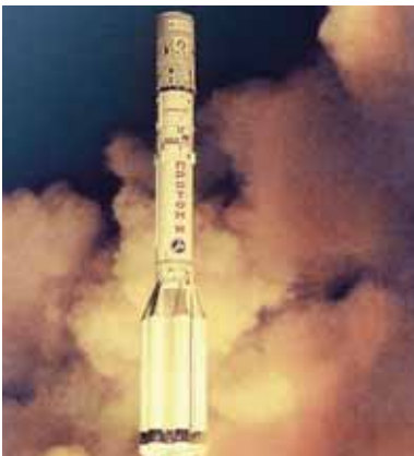
Proton – a tried and tested launch vehicle. However, malfunctions and failures are not uncommon due to the complexity of these systems.

In an attempt to save the satellite, its manufacturer EADS Astrium simulated various scenarios, including a spectacular “slingshot orbit” of the Moon that had already been successful with other satellites. However, the computations showed that none of the options would be successful. After consulting the insurers, EADS Astrium therefore proposed that the satellite be allowed to re-enter the earth’s atmosphere in order to prevent it from endangering other objects as space junk. The satellite burnt up over the South Pacific on the night of 23–24 March 2006.