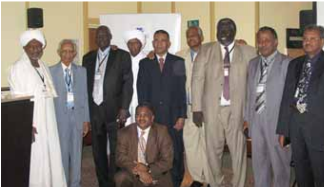
الوفد السوداني المشارك في القمة في لقطة خاصة لـ «البيان»