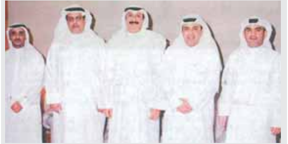
لقطة جماعية مع محافظ البنك المركزي