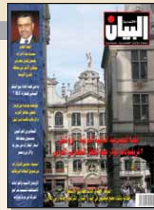
مدينة بروكسل حيث انعقدت القمة المصرفية الدولية العربية