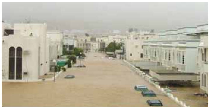
من اعصار GONU

ولم تتوافر احصاءات رسمية حول الجزء المغطى من شركات التأمين من تلك الخسائر. وذكر ان منشآت النفط والغاز في السلطنة في منطقة صور بقيت صامدة في وجه الاعصار ولم تلحق بها اضرار تذكر.