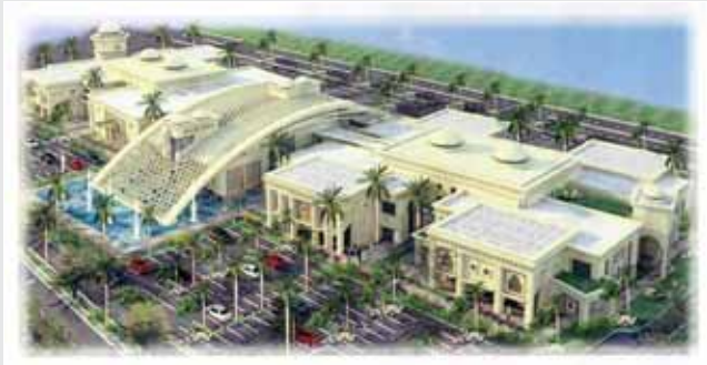
رسم تخيلي لمركز المبيعات الجديد

وأضاف عبد الله بن سليم: سيتم الاعلان لاحقا عن فعاليات ومرافق مستحدثة تعكس تميز المشروع.