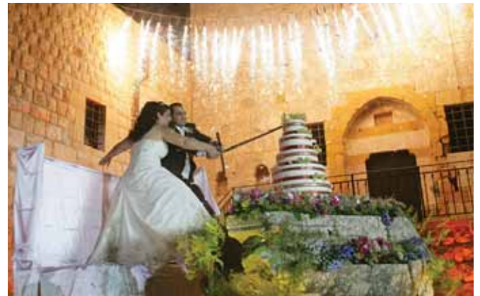
العروسان يقطعان قالب الحلوى