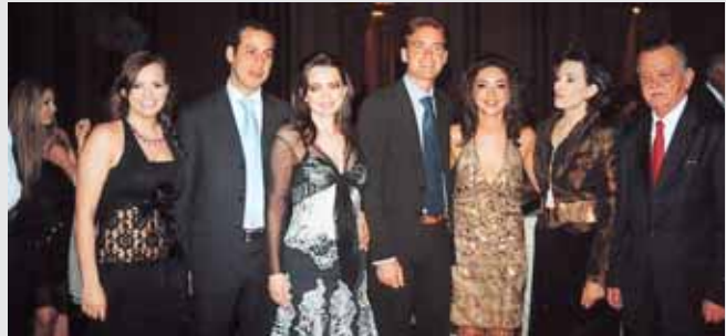
لقطة عائلية للأمير فيصل ارسلان وعقيلته حياة وأولادهما في صالة «بيال»