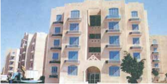
شركات خليجية اوجدت احياء جديدة في مصر