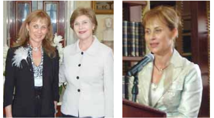
السيدة رعيدي مع السيدة بوش