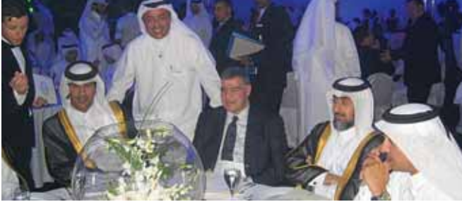
من اليمين: الشيخ فهد بن فيصل آل ثاني، وزير الاوقاف فيصل بن عبد الله آل محمود، د. احمد الجشي، وقفا صلاح الجيدة والشيخ جاسم بن حمد آل ثاني