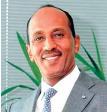
عمر الامين المشرق العربي

وقعت شركة المشرق العربي (ARAB ORIENT) الاماراتية اتفاقاً مع شركة وساطة في الفلبين تأخذ بموجبه على عاتقها توفير الرعاية الصحية للمقيمين في الامارات العربية المتحدة من حاملي الجنسية الفلبينية وعددهم يزيد عن ربع مليون شخص.