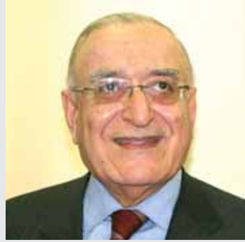
د. فرنسوا باسيل

قال رئيس جمعية مصارف لبنان فرنسوا باسيل ان هدنة المئة يوم التي تطالب بها الهيئات الاقتصادية غير كافية والمطلوب هدنة دائمة. وقال ان احدا لم يعد يثق بالسياسيين ومع ذلك فهو يحاول اقناع نفسه بأن السياسيين في لبنان لديهم الضمير والحكمة لمعالجة المشكلات السياسية والأمنية.