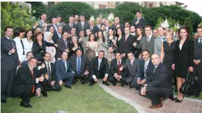
فريق عمل التأمين العربية السورية