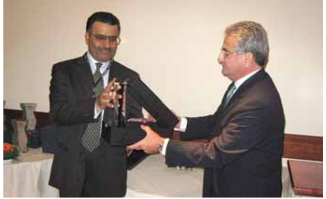
سليم صفيير يقدم درعا تقديريا لمعالي احمد الطاير