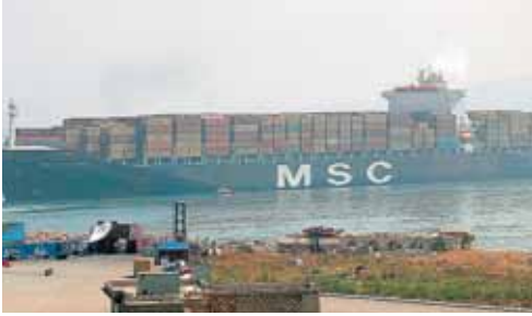
باخرة العملاقة MSC

أفادت حركة الحاويات في مرفأ بيروت ان وكالة MSC (لبنان) سجلت رقماً قياسياً جديداً بعدد الحاويات التي أمنت تفريغها خلال شهر أيار الماضي. فقد تبين ان هذه الوكالة التي ظلت محتفظة بالمرتبة الأولى أمنت استيراد ٥٧٥٧ حاوية نمطية برسم الاستهلاك المحلي، أي ما نسبته ٣٠٪ من مجموع الحاويات برسم الاستهلاك المحلي والبالغ ١٩٦٨٩ حاوية نمطية لشهر أيار. من جهة ثانية فازت MSC السويسرية بجائزة أفضل شركة ملاحه عابرة للمحيطات للعام ٢٠٠٧ "BEST OCEAN CARRIER OF THE YEAR 2007"، وذلك في إطار حفل توزيع جوائز جمعية وسطاء النقل الكندية في مدينة مونتريال الكندية.