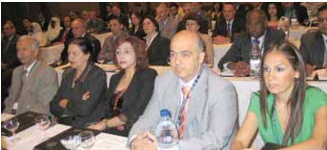
اركان آروپ سوريا

من هنا نشدد على استبعاد الاسنادات بنسبة ١٠٠ بالمئة، وندعو الشركات للتعاون في ما بينها كي تحتفظ بجزء مهم من الاقساط داخل السوق.