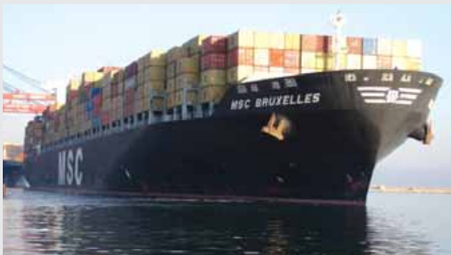
الباخرة MSC BRUXELLES خلال مغادرتها مرفأ بيروت

وسعتها ٩١٧٨ حاوية نمطية. وقدمت هذه الباخرة مباشرة من مرفأ أوروبا الشمالية وأفرغت في مرفأ بيروت ٦٤٩ حاوية وشحنت ٢١٨٤ حاوية. يذكر ان شركة MSC تحتل المرتبة الثانية في العالم، وتسير اسطولاً يضم ٢٤٠ باخرة تبلغ سعتها الاجمالية ١,١١٣ مليون حاوية نمطية.