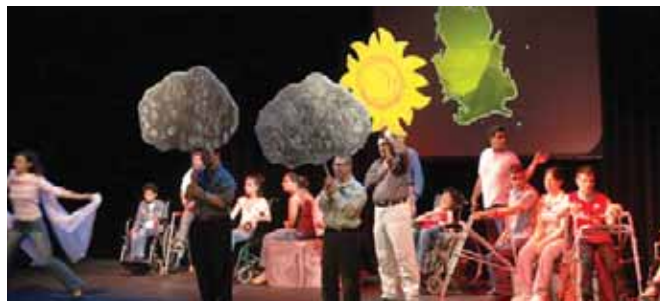
اطفال سيزوبيل يقدمون المسرحية