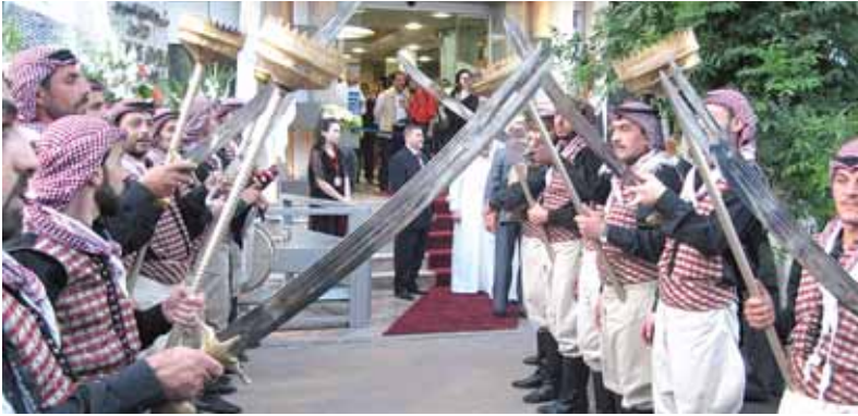
استقبال الضيوف بالسيوف والمشاعل