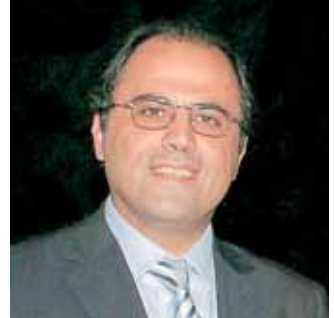
د. جهاد أزور