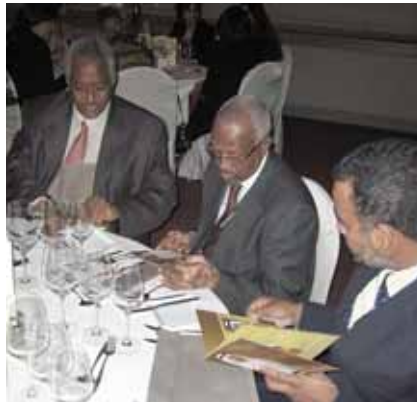
رؤساء ومدراء مصارف سودانيون