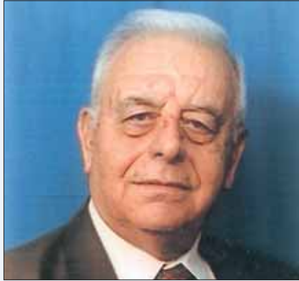
بمقام جميل حجار استشاري تأمين وإعادة تأمين

نفسى أو بخس في ذمتي وجعلت هذا المبلغ لسنة أو أكثر أدفعه بالكل أو بالنسبية. فيقبل الثاني ان يأخذ على عاتقه ما عرضه عليه الأول.