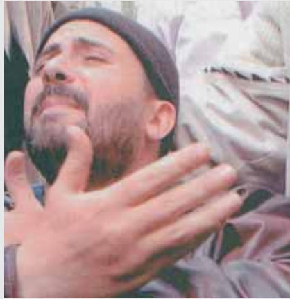
متداول لم يستطع السيطرة على اعصابه فانهار - راقبوا وجهه ويديه -

تشهد البورصة المصرية انهيارات في صفوف صغار المتداولين حيث يتداولون بناء على الشائعات المغرضة والمضللة، فيخسرون كل ما يراهنون به على الاسهم والعملات. قبل ان ننشر صورة لاحد «المنهارين» مأخوذة عن الجريدة الكويتية «السياسة» نذكر ما قاله ماجد شوقي رئيس بورصتي القاهرة والاسكندرية حول الشائعات: