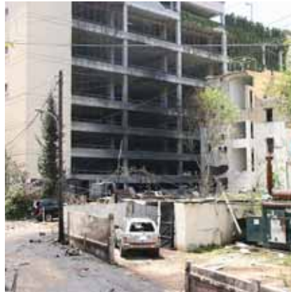
الارهاب في لبنان