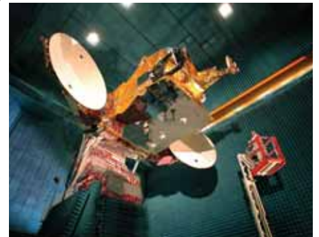
Communications satellite Arabsat 4A – not another piece of space junk. It burnt up in the earth’s atmosphere.

Conclusion As launch vehicles and satellites are both highly complex systems, malfunctions or failures are not uncommon in either system. It is therefore crucial for operators and creditors to limit the economic losses of such failures by means of launch or in-orbit insurance.