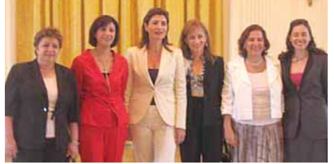
الوفد النسائي اللبناني