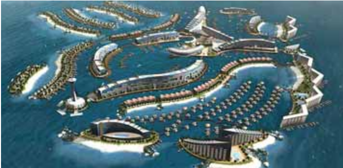
مجسم لمشروع جزر العالم

ويأتي مشروع «أوكيانا» ثمره التعاون بين مجموعة دولية من أبرز المطورين والمؤسسات الرائدة في مجال الهندسة والعمارة والنقل والمساحات الخضراء والبيئة وغيرها من الركائز الأساسية للمشروع. ويعد مشروع «أوكيانا» الجزء الأقرب إلى الشاطئ من «جزر العالم»، الأمر الذي يتيح لسكانه أفضل إطلالة على مدينة دبي. وبغية تعزيز المستوى المعيشي وجودة المرافق البحرية، يوفر المشروع حزمة من الشقق الفاخرة المتميزة بواجهات بحرية تتيح إطلالات بانورامية خلابة، إضافة إلى وحدات سكنية منعزلة تتصل بالجزر عبر جسور ووحدات سكنية تطل على القنوات المائية وفيلات ومنازل شاطئية. ويتسم مشروع «أوكيانا»، الذي يتألف من ٢٠ جزيرة تبلغ مساحتها الإجمالية ١,٨ مليون متر مربع، بعدد من الميزات الاستثنائية الأخرى بما فيها مرافق اجتماعية وفندقان ومنتجع فاخر ومطاعم ومقاهٍ راقية.