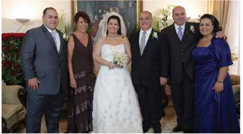
العروس محاطة بوالديها واشقاؤها وشقيقتها