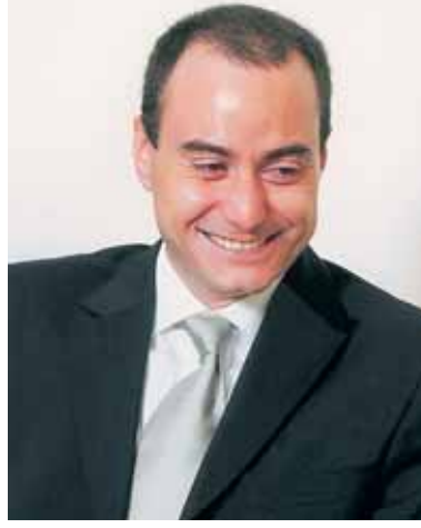
بقلم المهندس زياد زخور

لماذا نسكت على الجهل والتخلف وهما يحكمان سيطرتهما على مقدراتنا وحياتنا؟ نسكت لأننا جبناء... نسكت لأننا متخاذلون... نسكت لأننا ضعفاء... نسكت لأننا اغمضنا أعيننا وتغاضينا عن الحقيقة. نسكت لأننا نخاف ان نثور... نسكت لأننا لا نستحق هذا الوطن...!