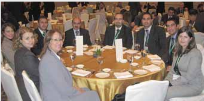
طاولة هيئة الاشراف على التأمين في الاردن