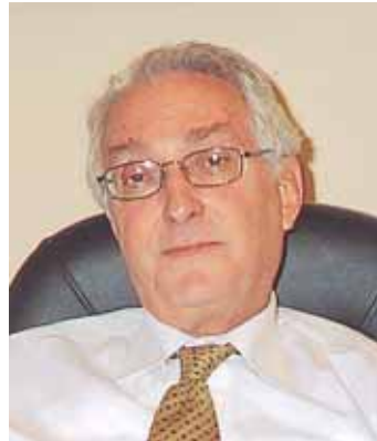
د. جورج قرم وزير المالية السابق

في مقال نشره في جريدة الأخبار عرض وزير المالية السابق الدكتور جورج قرم نقاط القوة في الوضع الاقتصادي، لا سيما ترسخ الثقة بالنظام المصرفي اللبناني والإقبال العربي على الاستثمار في لبنان. ومن بين نقاط القوة أيضاً ذكر الدكتور قرم الإيجابيات التالية: