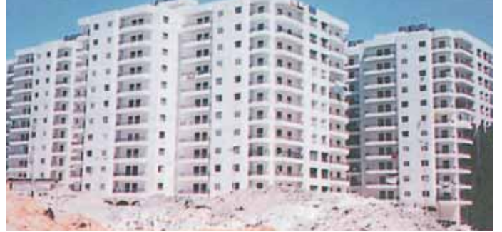
مجمعات سكنية انشئت على عجل