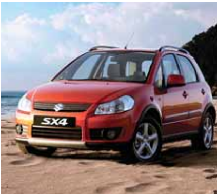
سيارة SUZUKI SX4

ولا ننسى سيارات APV و MPV الخاصة بالنقل ونقل الركاب إضافة الى XL7 وهي سيارة رباعية الدفع وتستوعب ٧ ركاب. ■