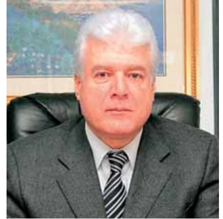
بقلم جوزف مجيد حرب المدير العام لبيروت كارغو سنتر

هذا مع الاشارة الى ان الاحصاءات الصادرة عن ادارة المرفأ تظهر ان واردات المرفأ الاجمالية المسجلة خلال الاشهر الخمسة الاولى من العام الجاري، على الرغم من الازعاج السياسية المتردية، جاءت افضل بكثير مما كانت عليه في العام الماضي، وهذه الواردات ستسجل نمواً