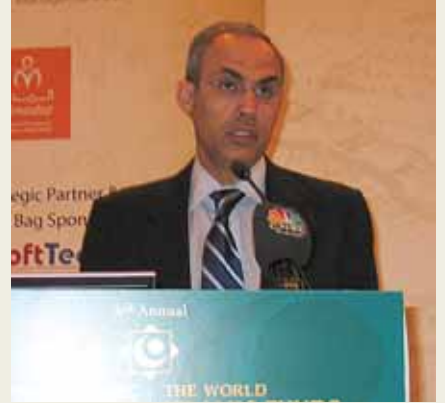
رشيد المعراج محافظ مصرف البحرين المركزي