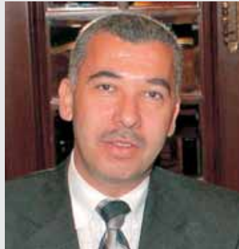
فاكر الرئيس LABUAN RE

نظمت شركة «لابوان ري» (LABUAN RE) الماليزية ندوة تدريبية للعاملين في اقسام اعادة التأمين في شركات التأمين العربية. وحضر الندوة التي انعقدت في المنامة - البحرين يومي ٢١ و٢٤ ايار (مايو) ٢٠٠٧، مسؤولو الاعادة في عدد من شركات التأمين العربية في كل من اليمن، قطر، ليبيا والبحرين. وقد استمع المشاركون خلال الدورة الى شروحات تتعلق بعمليات الاسناد والقبول.