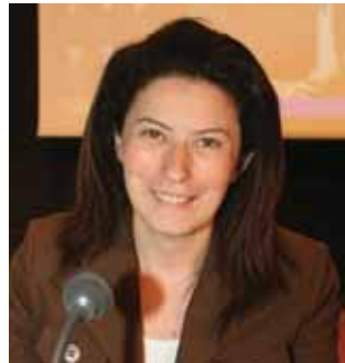
القاضي مارلين الجرّ