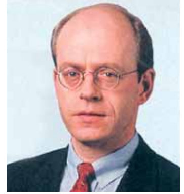
نيكولاس فون بومهارد

نيكولاس فون بومهارد الرئيس التنفيذي لشركة «ميونيخ ري» MUNICH RE أبلغ المساهمين خلال الجمعية العمومية التي عقدت لإقرار الميزانية والحسابات السنوية، ان الشركة تسعى لأن تحافظ على ربحيتها إلا انه توقع ألا تتجاوز أرباح هذه السنة ٣ مليارات يورو، موضحاً أن الأرباح المحققة خلال سنة ٢٠٠٦ كانت استثنائية. لأن الأسواق لم تعرف كوارث غير عادية. وقد لا تتكرر هذه السنة. وكانت الشركة حققت خلال سنة ٢٠٠٦ أرباحاً بلغت قيمتها ٣,٥ مليار يورو. كما أبلغ المساهمين ان «ميونيخ ري» تخوض مفاوضات مع جهات متعددة بغية إنجاز عمليات استحواذ ACQUISITION جديدة. وقال ان «ميونيخ ري» تبحث وبخاصة خارج ألمانيا عن شركات تأمين سواء للاستحواذ عليها أو إقامة مشروعات مشتركة معها. كما وتسعى «ميونيخ ري» لأن تكون أكبر مقدمي خدمات الصحي في العالم.