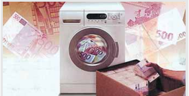
اليورو.. العملة المفضلة لشبكات غسل الأموال

أدى ارتفاع الطلب على المخدرات في أوساط الأوروبيين الى ازدياد أسعارها في السوق الأوروبية عنها في الولايات المتحدة وارتفاع قيمة العملة الأوروبية مقابل الدولار الى مستويات غير مسبوقة.