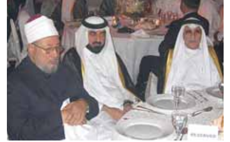
يظهر من اليسار: الشيخ د. يوسف القرضاوي وعدد من الشخصيات