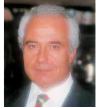
يكتبها د. عبد الحميد البيرير

كذلك يأتينا هذا الكلام أيضاً عندما نتفقد بحزن وأسى حال بلدنا وأحوال شعبنا، وبما يزخر به هذا الوطن الصغير لبنان من مقومات خير وجمال، وما أبدعته يد الخالق العظيم من لوحات وعبقرية، وما انتجه نظامه الليبرالي الواسطي من حريات سياسية واقتصادية وفكرية، ومن انفتاح وتواصل، كان من المفروض ان تجعل منه فردوساً حقيقياً للاستقرار والحياة والعمل، علماً أنها عوامل ربما كانت سبباً في إثارة حفيظة الحاقدين والحاسدين، فشرعوا