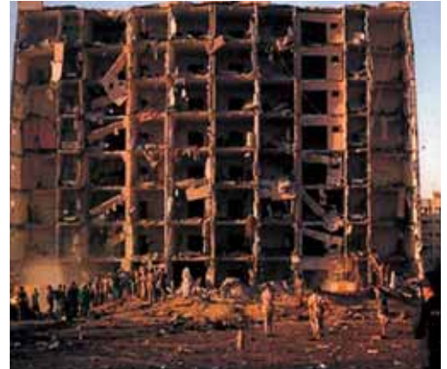
الارهاب في السعودية

اصدرت شركة غاي كاربنتر لوساطة الاعادة (GUY CARPENTER) وهي شركة تابعة لمجموعة مارش MARSH تقريرا حول آخر التطورات التي طرأت على التأمين ضد اخطار الارهاب TERRORISM INSURANCE.