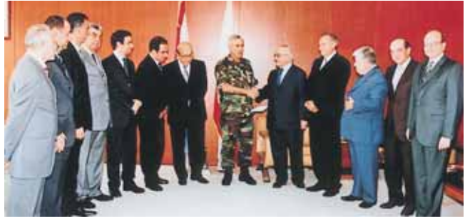
العماد ميشال سليمان يتسلم الشيك من رئيس واطباء جمعية المصارف

قام مجلس ادارة جمعية مصارف لبنان برئاسة الدكتور فرنسوا باسيل، بزيارة قائدة الجيش العماد ميشال سليمان في اليرزة في ١٣/٦/٢٠٠٧، وسلمه شكا بقيمة مليوني دولار اميركي، هو عبارة عن هبة مالية مقدمة من القطاع المصرفي اللبناني، لصالح شهداء الجيش