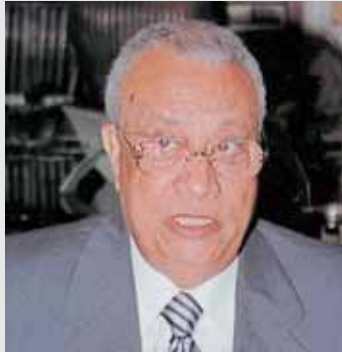
د. عاطف عبيد رئيس المصرف العربي الدولي

كما الكويت والاردن، تشهد مصر اقبالاً ملحوظاً من المتمولين على تأسيس شركات تمارس التأمين بصيغته التكافلية، فقد اعلن في القاهرة عن تأسيس شركتين جديدتين للتأمين التكافلي، اولاهما تتعاطى التأمينات العامة (NON LIFE) والثانية تخصص لتعاطي التأمين على الحياة (LIFE) وتكوين الرساميل والاستثمار، يقبض على اسهم الشركتين المصرف العربي الدولي، ويرأس مجلس الادارة في كل من الشركتين رئيس مجلس ادارة المصرف العربي الدولي الدكتور عاطف عبيد، وهو رئيس سابق لمجلس الوزراء في مصر، وتقرر ان يكون رأسمال كل من الشركتين الجديدتين ٥٠ مليون جنيه مصري، وان تباشرا اعمالهما اعتباراً من مطلع العام المقبل.