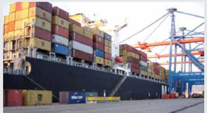
الباخرة MSC BRUXELLES أثناء عملية تفريغها وشحنها في مرفأ بيروت

وسعتها ٩١٧٨ حاوية نمطية. وقدمت هذه الباخرة مباشرة من مرفأ أوروبا الشمالية وأفرغت في مرفأ بيروت ٦٤٩ حاوية وشحنت ٢١٨٤ حاوية. يذكر ان شركة MSC تحتل المرتبة الثانية في العالم، وتسير اسطولاً يضم ٢٤٠ باخرة تبلغ سعتها الاجمالية ١,١١٣ مليون حاوية نمطية.